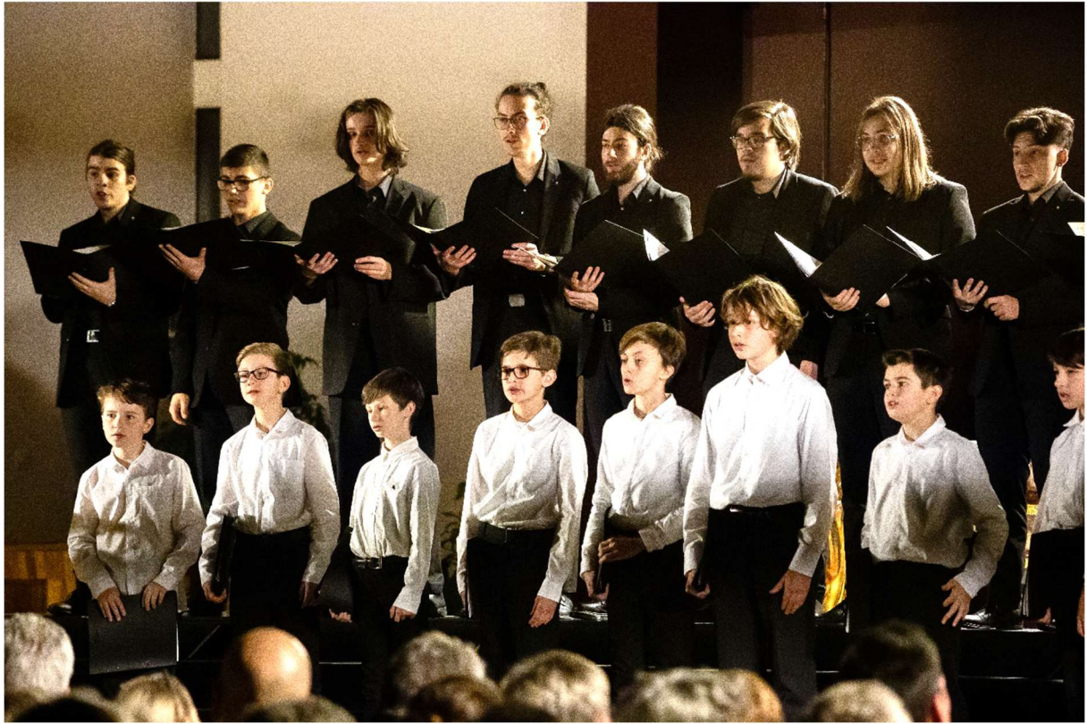
Petits Chanteurs, concerts de Noël 2023