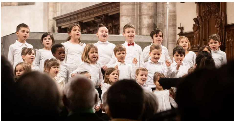
Petites Nouvelles et Petits Nouveaux, Cathédrale, Sainte Cécile, novembre 2023

Véritable ADN de la Schola, la formation chorale reste basée sur une collaboration régulière entre enfants et jeunes adultes : les chanteuses et les chanteurs plus âgés soutiennent les plus jeunes jusqu'à ce qu'ils ou elles soient à leur tour en mesure de transmettre leurs connaissances et leur expérience aux forces nouvelles.