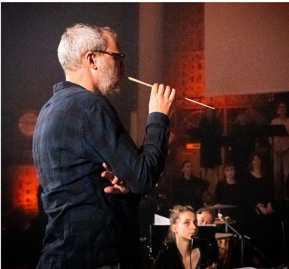
90 ème anniversaire de la Schola, Eli, Eli ! une passion (11-12 mars 2022)