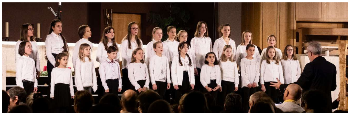
Petit Chœur de filles, concerts de Noël (17-18 décembre 2022)

Véritable ADN de la Schola, la formation chorale reste basée sur une collaboration régulière entre enfants et jeunes adultes : les chanteuses et les chanteurs plus âgés soutiennent les plus jeunes jusqu'à ce qu'ils ou elles soient à leur tour en mesure de transmettre leurs connaissances et leur expérience aux forces nouvelles.