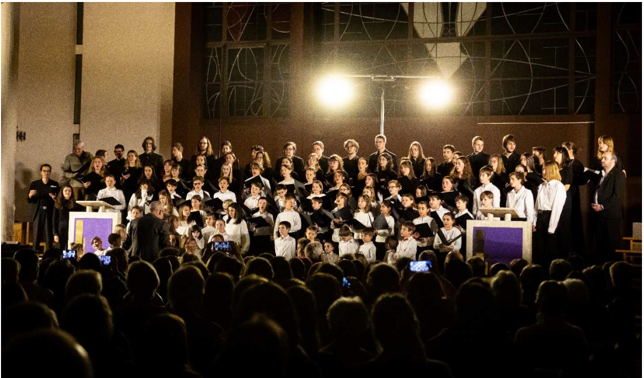
Tous les chœurs, concerts de Noël 2023