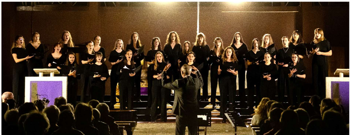
Grand Chœur de Filles, concerts de Noël 2023